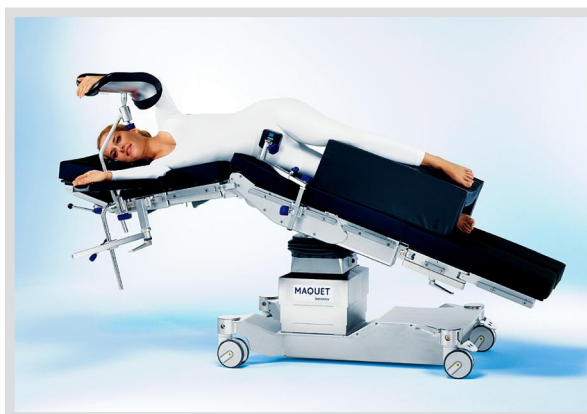
BETASTAR: пример комплектации стола для проведения операций на почке (реверсивная ориентация пациента)