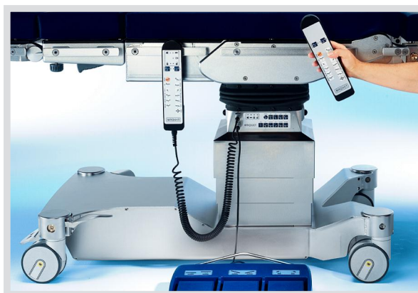
Многообразие элементов управления функциями стола