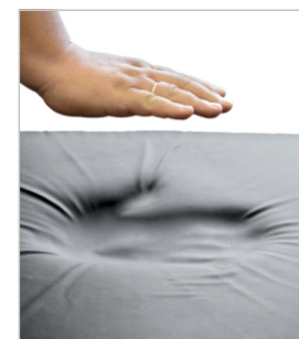
Вязкоэластичный матрас с эффектом памяти