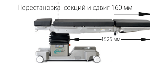
Продольный сдвиг панели (320 мм, с пульта), перестановка головной и ножной секций