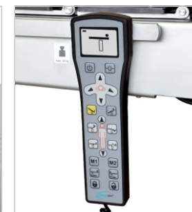
Проводной пульт управления (стандартная поставка)