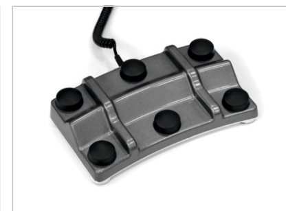
Педальный блок управления (опция)