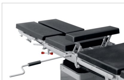
Механический встроенный почечный валик (опция)