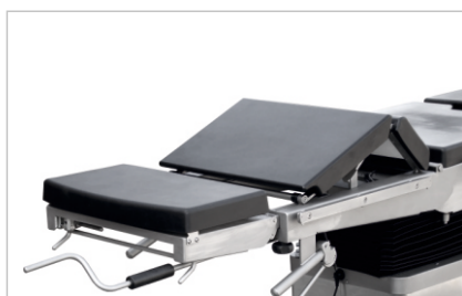
Механический излом спинной секции (опция)