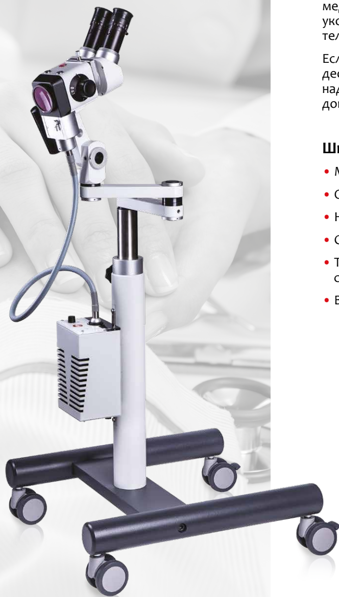
Карс КР 3000 с наклонным тубусом на мобильной стойке

Карс КР 3000 – идеальный кольпоскоп для ежедневных рутинных обследований. Совместно с дополнительными аксессуарами он отвечает высоким стандартам качества при привлекательной цене.