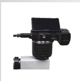
HD-фотоадаптер для Sony