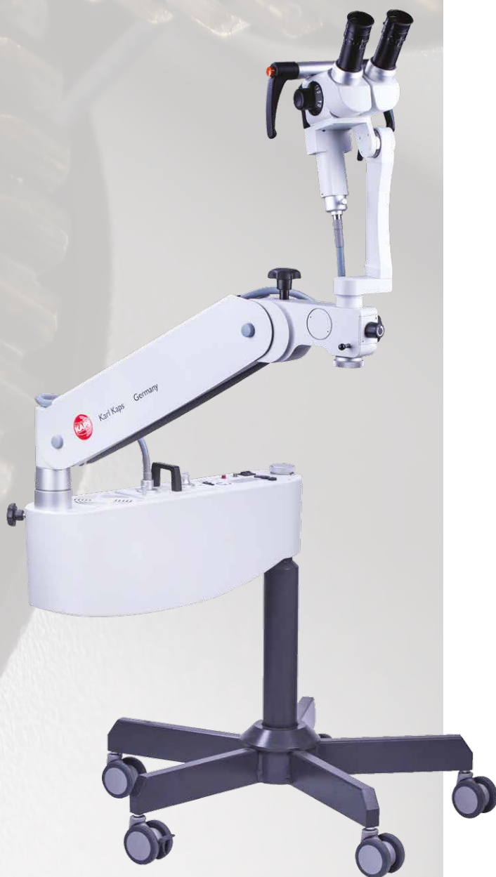
Kaps SOM 52 с наклонным тубусом на мобильной стойке

Благодаря мобильной стойке SOM 52 может использоваться в любом кабинете. Кольпоскоп Kaps SOM специально адаптирован для повседневной работы на гинекологическом приеме и успешной диагностики и лечения.