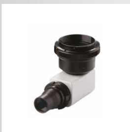
Фототубус для DSLR камеры