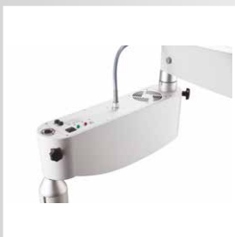
дополнительное светодиодное освещение