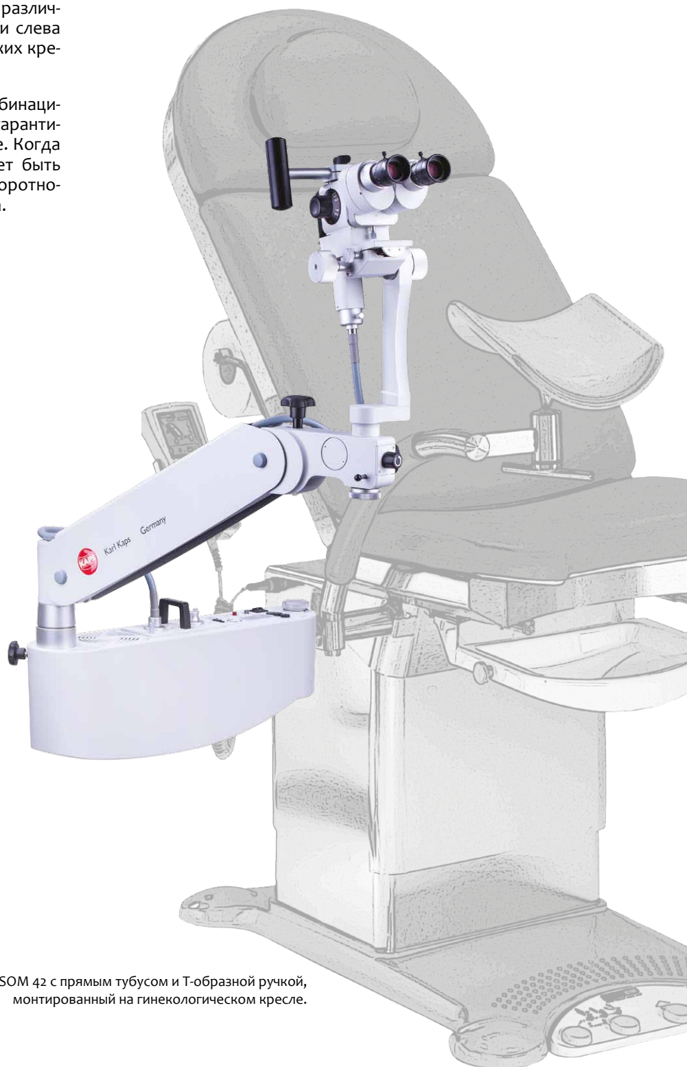
Кaps SOM 42 с прямым тубусом и Т-образной ручкой, монтированный на гинекологическом кресле.

Точная установка обеспечивается комбинацией прямого и поворотного плеча. Это гарантирует удобное и быстрое использование. Когда кольпоскоп не используется, он может быть отодвинут в сторону, а благодаря поворотному плечу он занимает очень мало места.