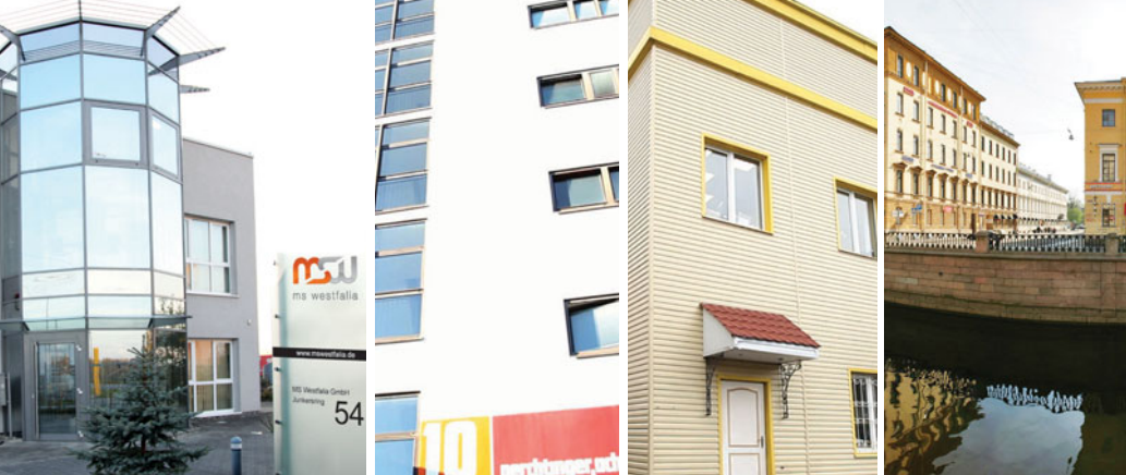
Головной офис Тройсдорф