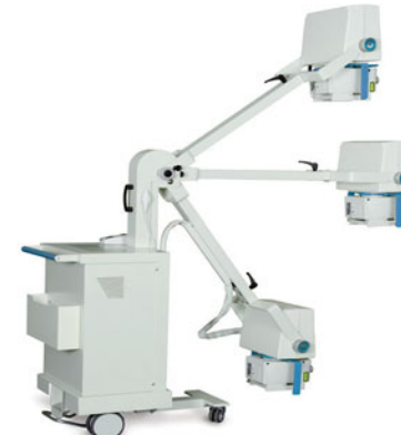
03 Передвижные рентгеновские аппараты