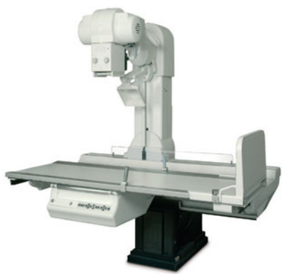
01 Стационарные рентгеновские системы