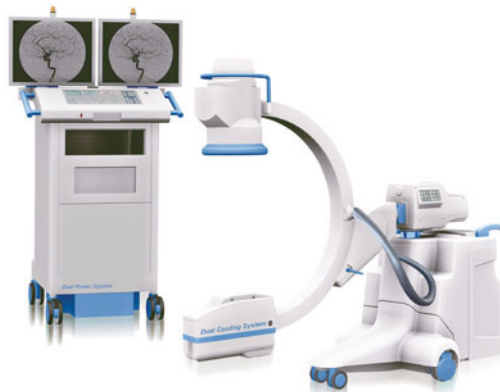
02 Рентгенохирургические установки типа “С-дуга”