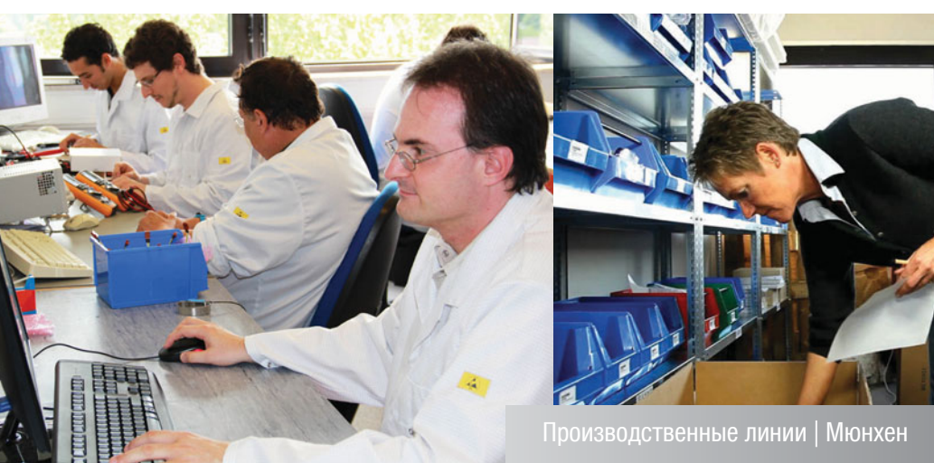
Производственные линии | Мюнхен